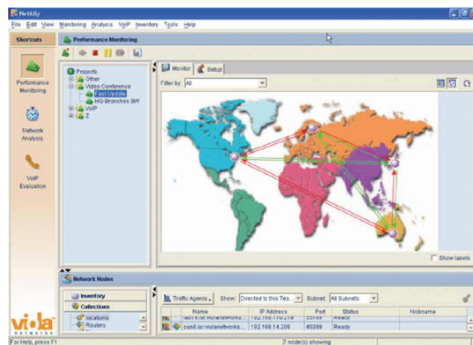
Figure 3 : les performances de téléphonie IP font l'objet d'une surveillance sur l'ensemble du réseau distribué.